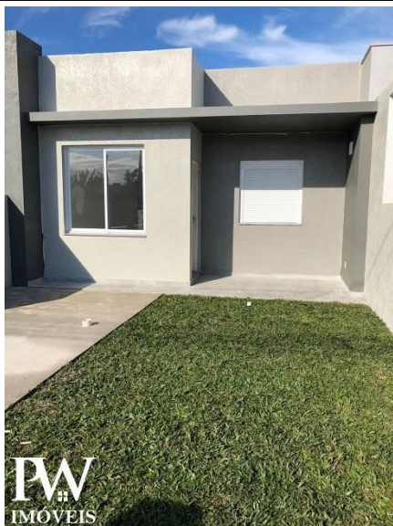
Representação Fachada Principal