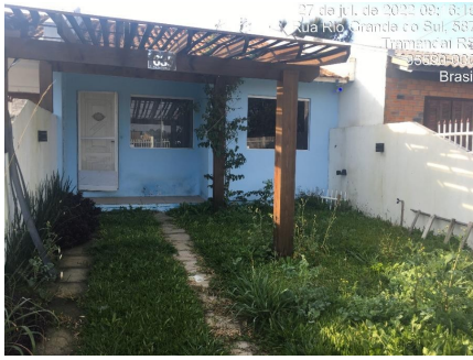
Representação Fachada Principal