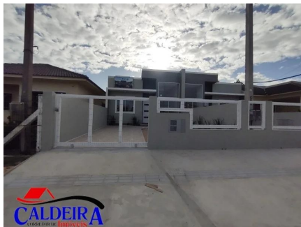
Representação Fachada Principal