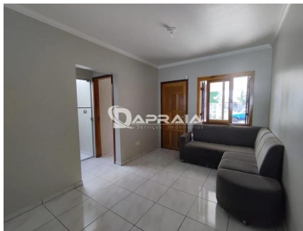
Representação Sala de Estar / Visitas