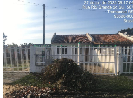
Representação Fachada Principal