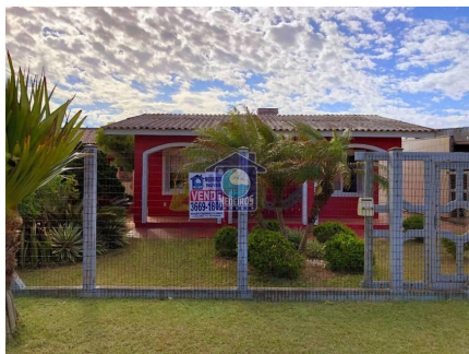
Representação Fachada Principal