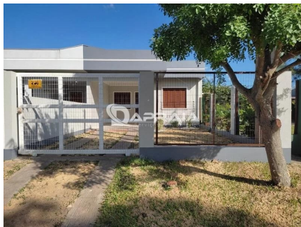
Representação Fachada Principal