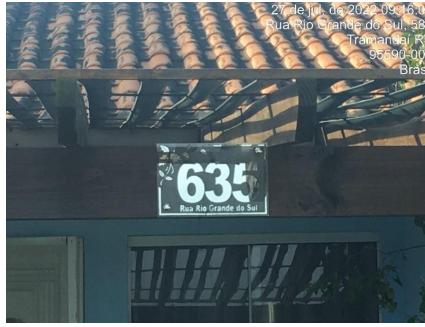
Representação Identificação Numérica

Descrição Identificação numérica do avaliando.