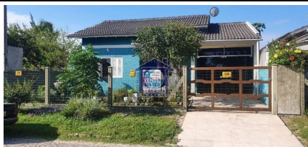
Representação Fachada Principal