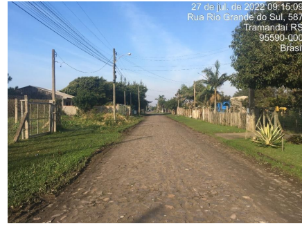
Representação Vista da Rua