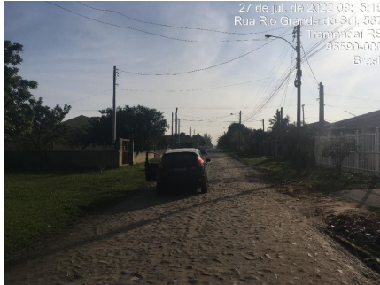
Representação Vista da Rua