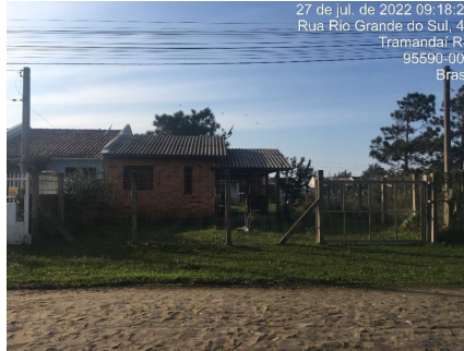
Representação Fachada Principal