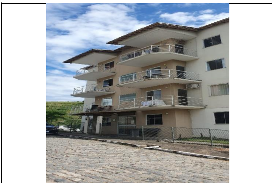
FACHADA DO CONDOMÍNIO