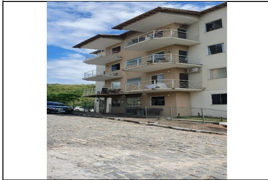
FACHADA DO CONDOMÍNIO