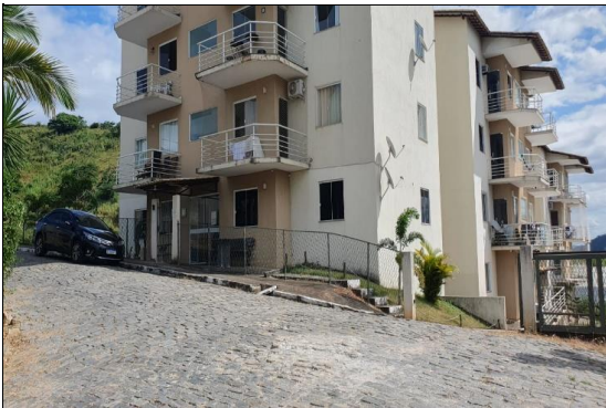
FACHADA DO CONDOMÍNIO