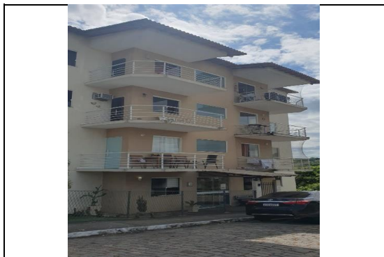
FACHADA DO CONDOMÍNIO