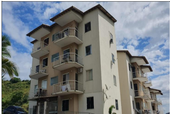
FACHADA DO CONDOMÍNIO