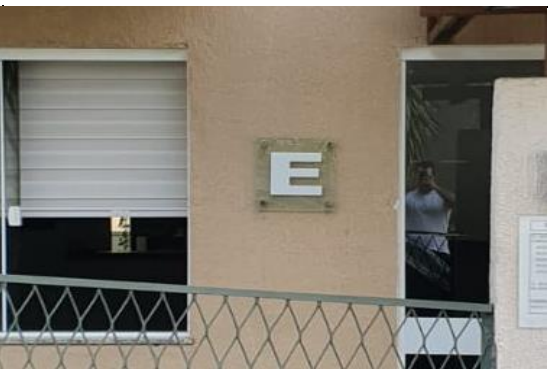
IDENTIFICAÇÃO DO BLOCO